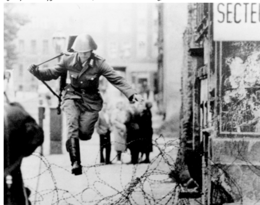
Den Kolde Krig: Berlinmuren opføres august 1961, og østtysk soldat flygter til Vestberlin.

De potentielle ansøgerlande har igennem Partnership for Peace (PfP) initiativet fået mulighed for at indgå bilaterale aftaler med NATO og på den måde deltage aktivt i NATOs operationer. Partnership for Peace er altså lidt af en øvelsesplads for ansøgerlandene, men er ingen garanti for optagelse. MAP, som står for Membership Action Plan, er derimod et skridt imod reel optagelse i fællesskabet.