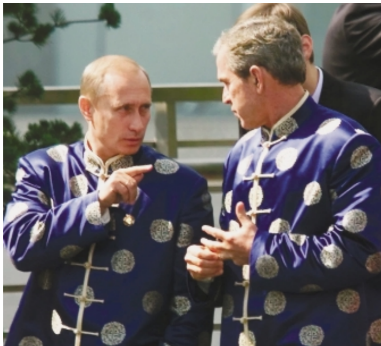
Det nye NATO? Putin og Bush i Kina oktober 2001