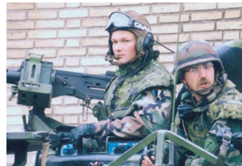
Nye tider: Dansk og baltisk militær samarbejder.

Der findes ni MAP-lande: Albanien, Bulgarien, Estland, Letland, Litauen, Makedonien, Rumænien, Slovakiet og Slovenien. MAPs formål er at assistere de lande, som ønsker medlemskab med råd og praktisk støtte. Lande, som ønsker medlemskab, skal aflevere en årlig rapport omhandlende forberedelserne på optagelsen på det politiske, økonomiske, forsvarsmæssige, ressourcemæssige, sikkerhedspolitiske og juridiske område. På topmødet i Prag i november 2002 tager NATOs forsvarsministre MAP op til revision og diskuterer udviklingen. Fuld deltagelse i det operationelle Partnership for Peace er væsentligt, når det enkelte land vurderes. Deltagelse i MAP er ikke ensbetydende med NATO-medlemskab.